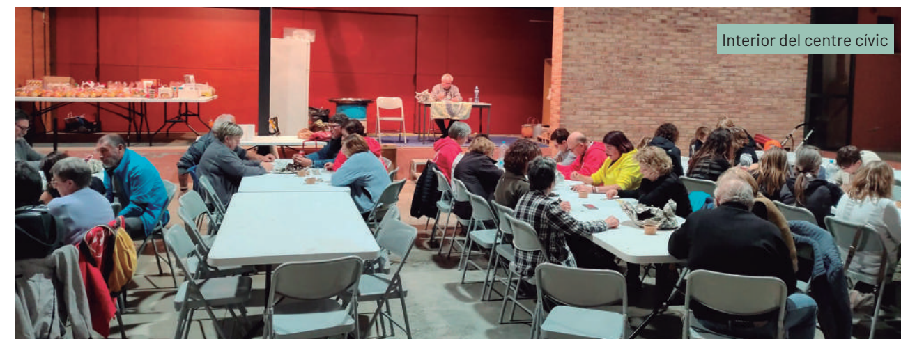
Interior del centre cívic

L'Ajuntament està ultimant una ordenança per concretar els usos del centre cívic. L'objectiu d'aquest reglament és regular les condicions d'ús i funcionament del centre cívic de Viladasens. El centre cívic és un equipament municipal que vol oferir l'espai necessari perquè es puguin desenvolupar activitats cíviques, socials, culturals, esportives i de lleure, així com afavorir la participació ciutadana en aquells assumptes de la comunitat que fomentin la difusió de valors i la convivència associativa. La normativa establirà l'ús de les instal·lacions, com disposar del centre i quines activitats s'hi podran portar a terme.