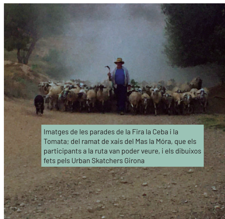
Imatges de les parades de la Fira la Ceba i la Tomata; del ramat de xais del Mas la Móra, que els participants a la ruta van poder veure, i els dibuixos fets pels Urban Sketchers Girona

l'Aixart de Cervià de Ter, que es van exposar en el centre cívic el dia de la festa. De tots aquests es van escollir els tres més artístics i d'aquests el primer premi. Al guanyador se li va regalar una caixa de llapis de colors i un bloc de dibuix. A part, es va sortejar un lot de productes de proximitat.