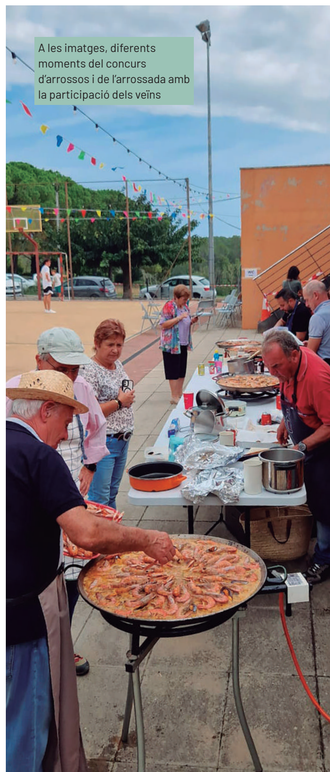
A les imatges, diferents moments del concurs d'arrossos i de l'arrossada amb la participació dels veïns

Diuenge dia 15 es va celebrar, com ja és tradició, la missa d'ofici a l'església de Sant Vicenç, acompanyada per la cobla Cervianenca. Seguidament, va haver-hi sardanes a la pista del centre cívic a